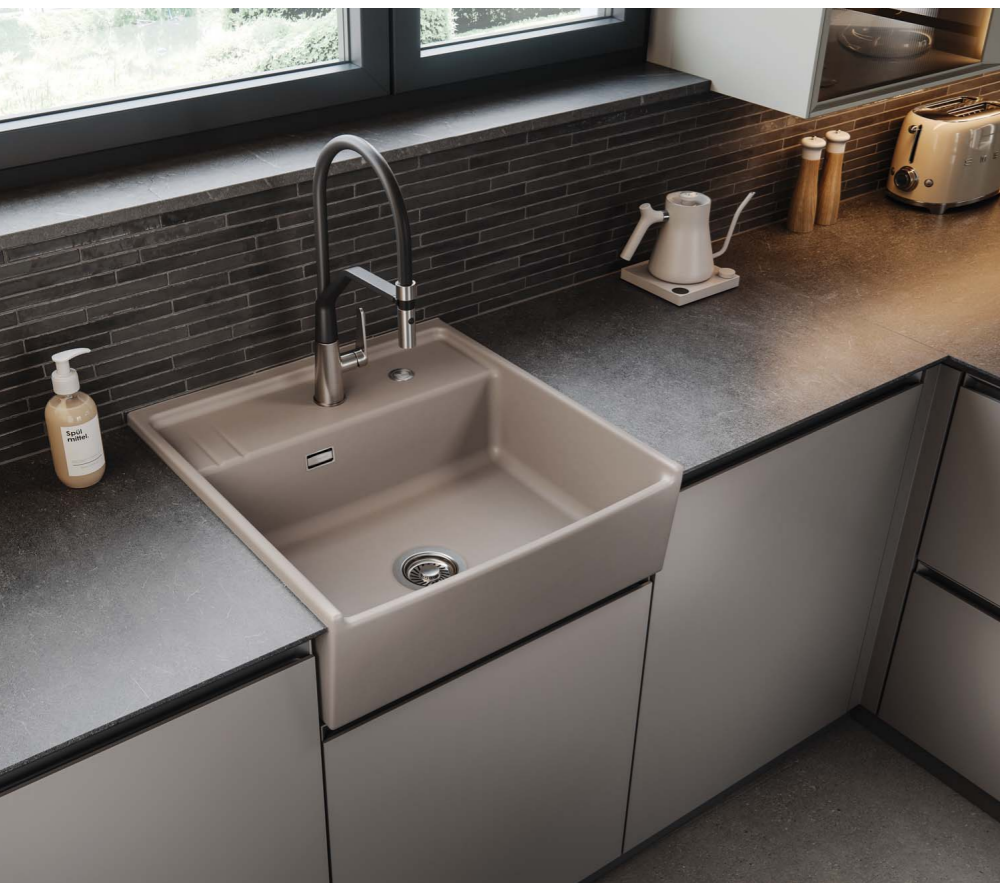
KENTRO 60 in Fango

Kochen und Küche sind heute mehr denn je Ausdruck für Lebenseinstellungen. Ein gutes Produktdesign macht dazu keine Vorschriften.