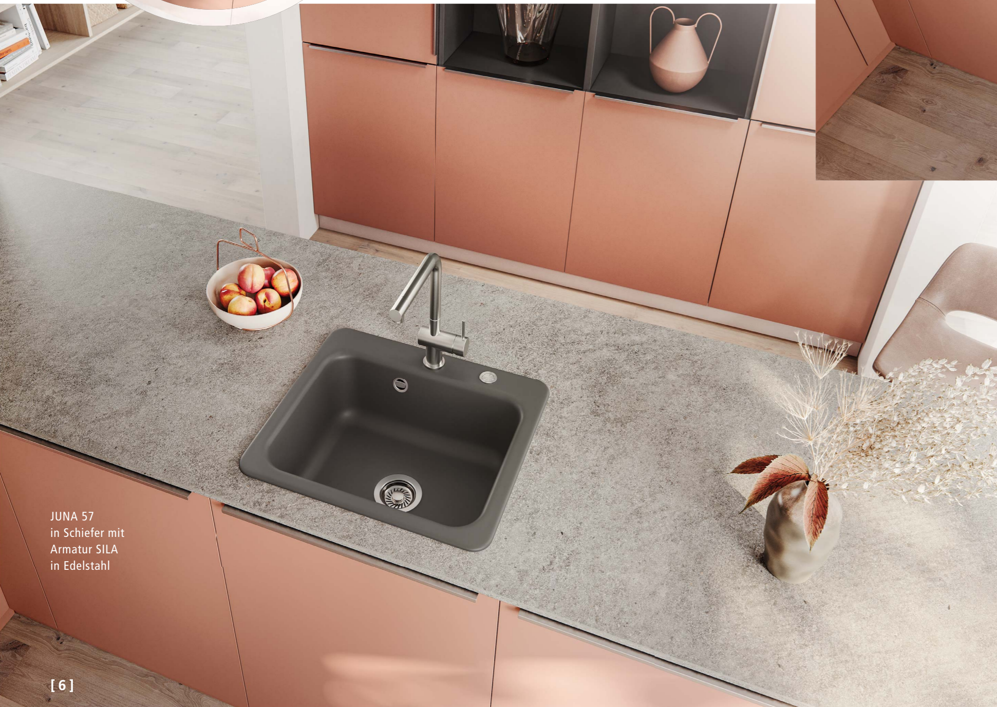
JUNA 57 in Schiefer mit Armatur SILA in Edelstahl