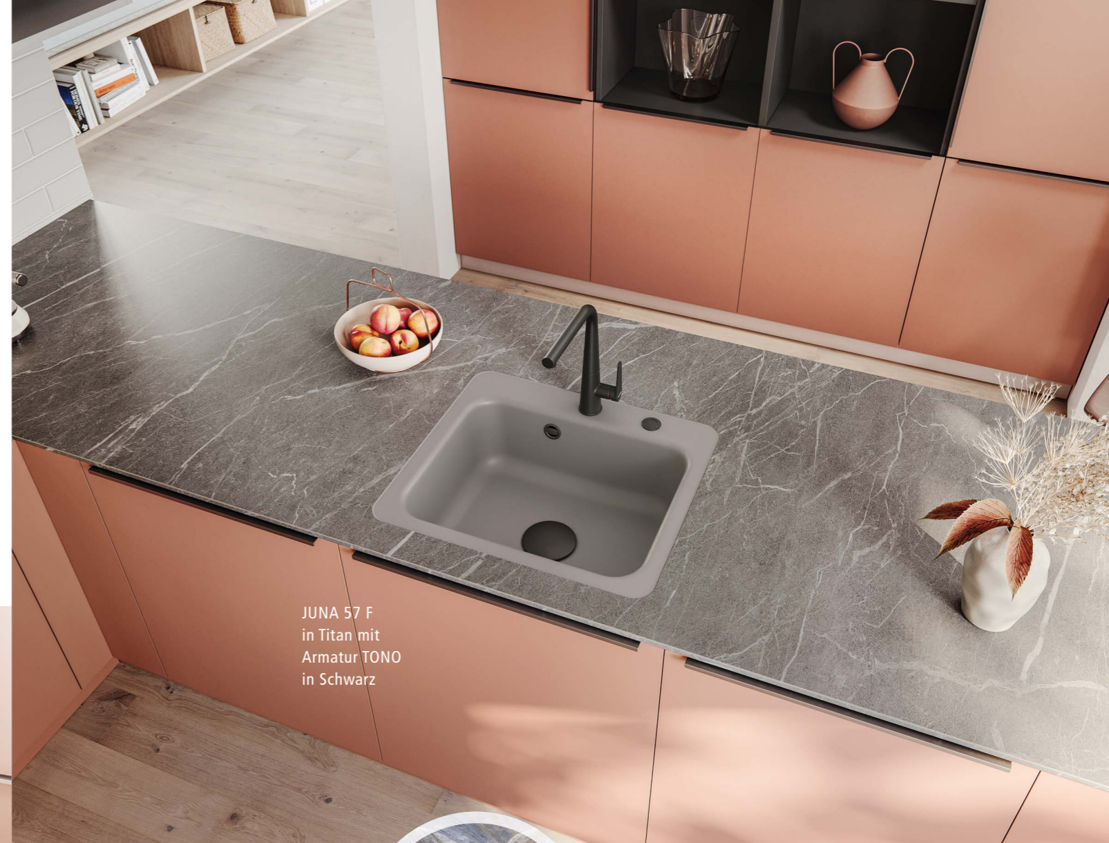
JUNA 57 F in Titan mit Armatur TONO in Schwarz