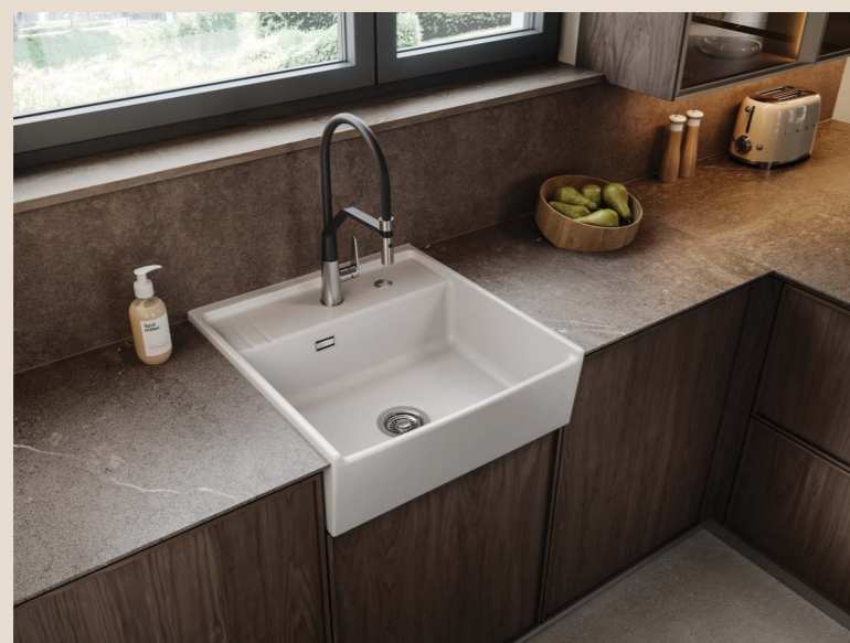
KENTRO 60 in Grönland