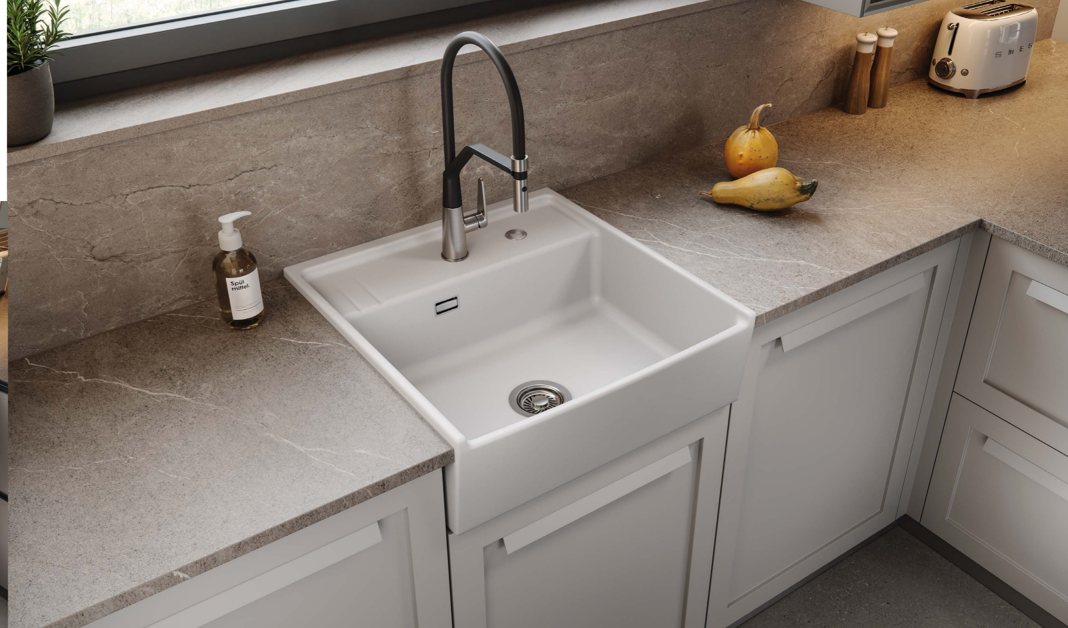
KENTRO 60 in Polar