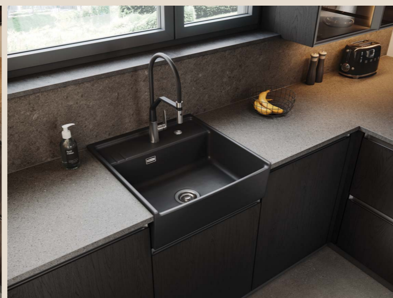
KENTRO 60 in Nigra