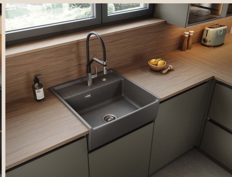
KENTRO 60 in Lava

Die KENTRO 60 inspiriert in alle Einrichtungsstil-Richtungen denken zu dürfen. Schließlich wird sie immer als genau die richtige Wahl erscheinen.